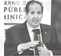
Ministro Víctor Atallah.

El ministro de Salud, Dr. Víctor Atallah, informó este domingo que este año se implementó la Resolución 0007-2025, que establece las Directrices de Atención Integral en Salud a Mujeres en Situación de Violencia de