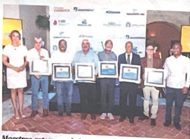
Maestros artesanos de larimar y ambar.

"Tenemos la posibilidad, a través de los turistas, de hacer crecer el conocimiento no solo del mineral, sino,